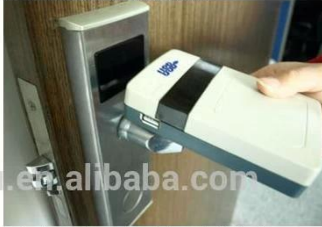
collect opening records from hotel lock