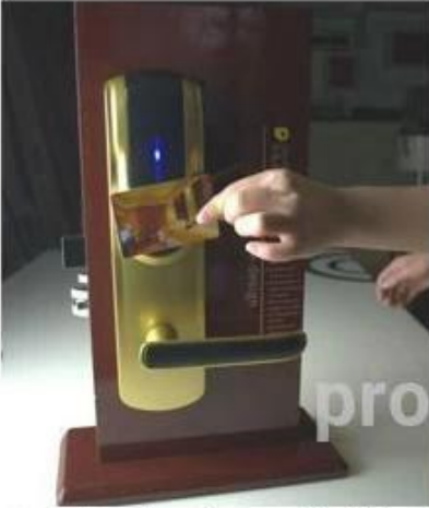
opening the door with RF card