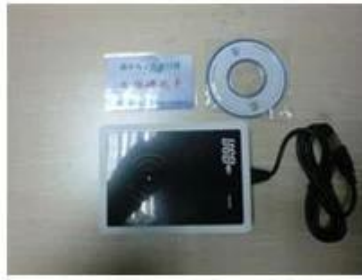
RF card reader (used for issuing room card to guests)