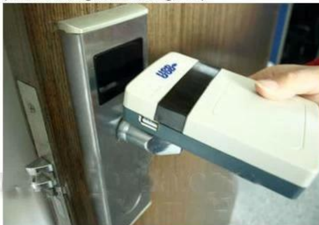
collect opening records from hotel lock

RF ID карты отель keycard блокировки завод, высокая безопасность Отель блокировки Поставщик