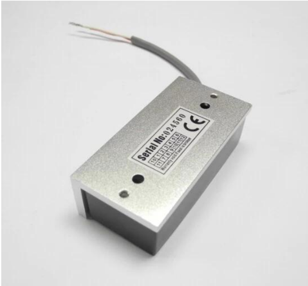
China Magnetverschluss Hersteller, Guangdong Magnetic Lock Hersteller