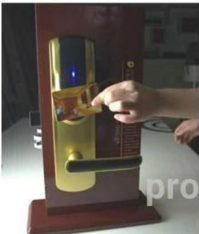
opening the door with RF card