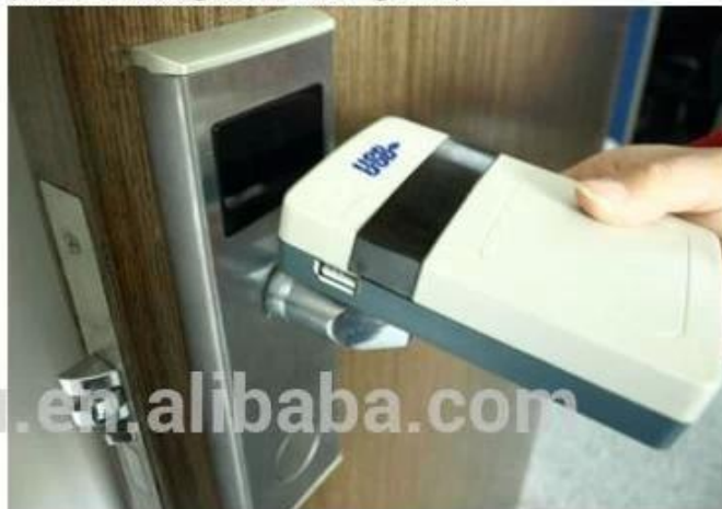
collect opening records from hotel lock