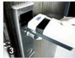
3 Data Collector