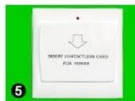
5 Gain Power Switch