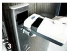
3 Data Collector