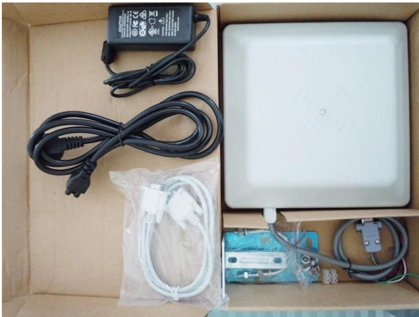
Uhf rfid lector módulo precio instalación en el sitio