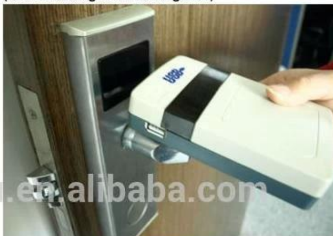
collect opening records from hotel lock