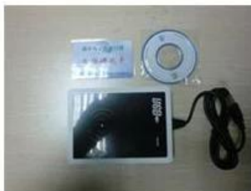
RF card reader (used for issuing room card to guests)