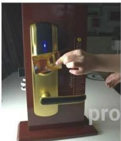
opening the door with RF card