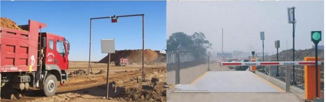
Uhf rfid lecteur module prix lire autres cartes UHF