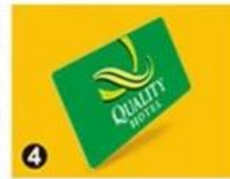
4 RF Card