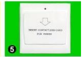
5 Gain Power Switch