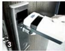
3 Data Collector