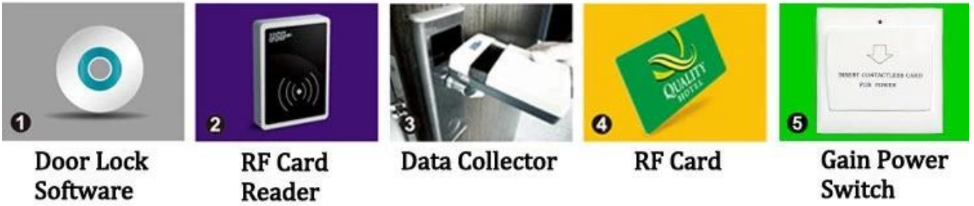
Door Lock Software