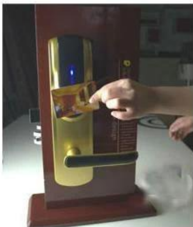
opening the door with RF card