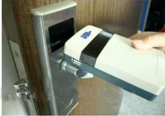
collect opening records from hotel lock

Fabbrica di serratura di alta sicurezza hotel keycard