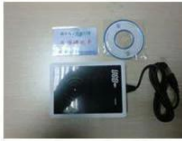
RF card reader (used for issuing room card to guests)