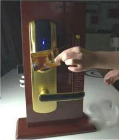
opening the door with RF card