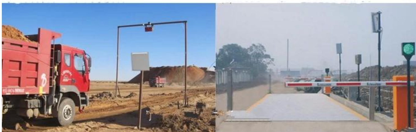
UHF rfid reader modulo prezzo Leggi altre carte UHF