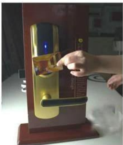
opening the door with RF card