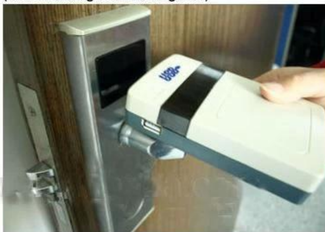
collect opening records from hotel lock

Hoog beveiligingsniveau hotel sleutelkaarten lock fabriek