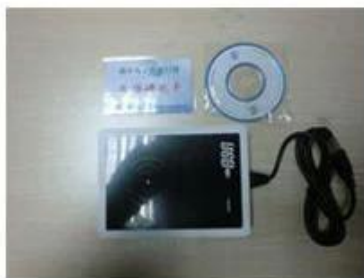
RF card reader (used for issuing room card to guests)