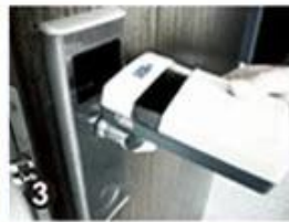
3 Data Collector