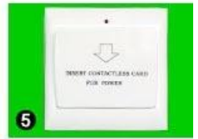
5 Gain Power Switch