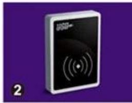
2 RF Card Reader