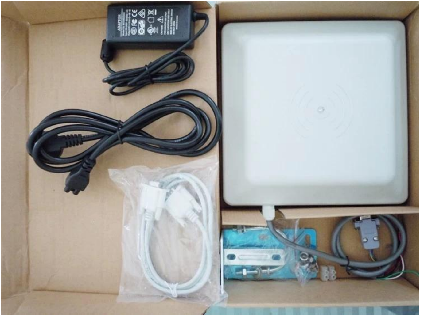
Uhf rfid reader module price installation on site