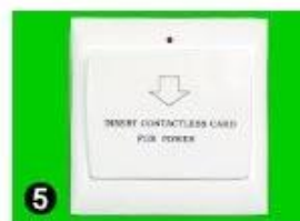
5 Gain Power Switch