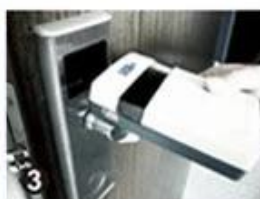
3 Data Collector