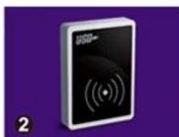
2 RF Card Reader