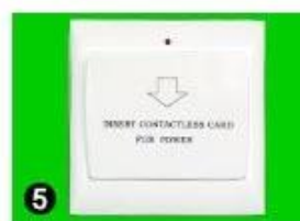
5 Gain Power Switch