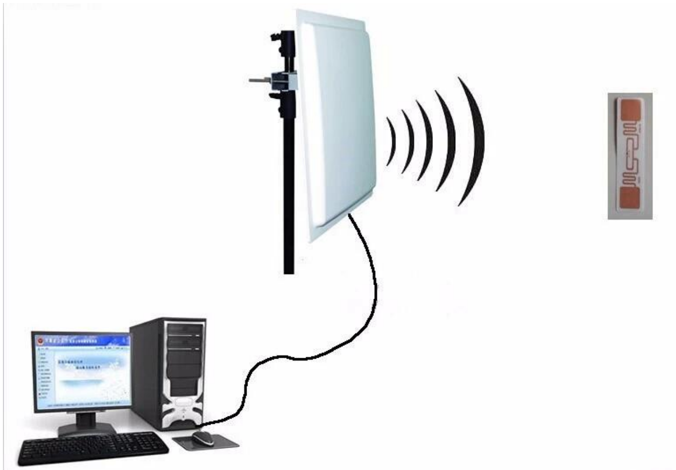
uff RFID Reader